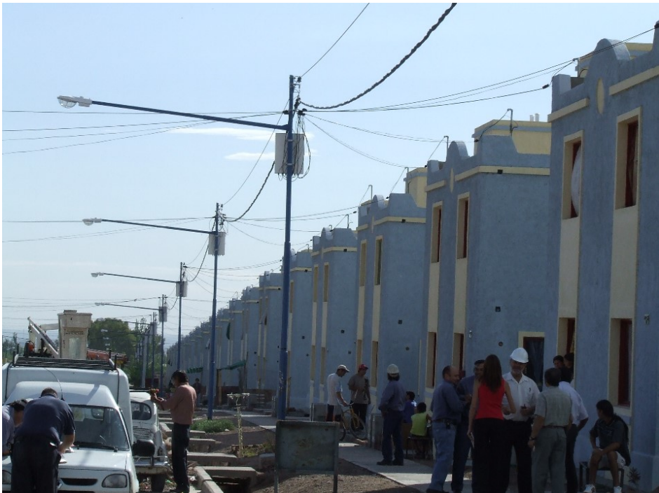
UBICACIÓN DE LAS CAJAS PERPENDICULARES A LA LÍNEA DE DISTRIBUCIÓN ACOMETIDAS DE VIVIENDAS TIPO DUPLEX. RETENCIÓN REALIZADA SOBRE LA PARED LAS FOTOGRAFÍAS SON SÓLAMENTE INDICATIVAS

PLIEGO ESPECIFICACIONES TÉCNICAS PARTICULARES para Concurso, Contratación y Ejecución de Obra ETP: 27 de 30