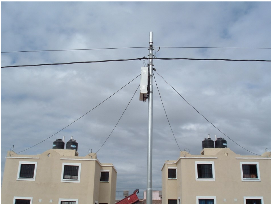
UBICACIÓN DE LAS CAJAS PERPENDICULARES A LA LÍNEA DE DISTRIBUCIÓN ACOMETIDAS DE VIVIENDAS TIPO DUPLEX. RETENCIÓN REALIZADA SOBRE LA PARED LAS FOTOGRAFÍAS SON SÓLAMENTE INDICATIVAS