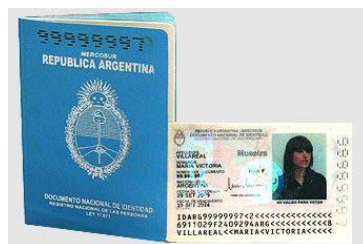
DNI LIBRETA Y TARJETA CELESTE DIGITAL