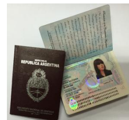
DNI LIBRETA Y TARJETA BORDÓ DIGITAL