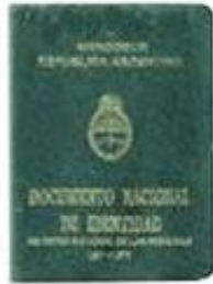
DNI VERDE MANUSCRITO

(A TODOS LOS DEMAS FINES, MANTENDRÁN SU PLENA VALIDEZ Y VIGENCIA HASTA EL 31 DE MARZO DE 2017):