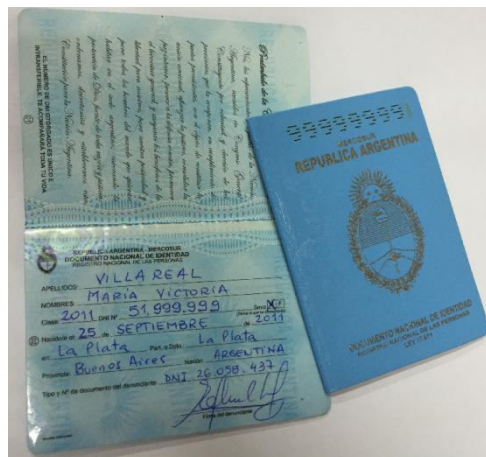
DNI CERO AÑO TAPA CELESTE CONFECCIÓN MANUAL (MANUSCRITO)