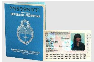
DNI LIBRETA CELESTE DIGITAL