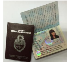
DNI LIBRETA BORDO DIGITAL