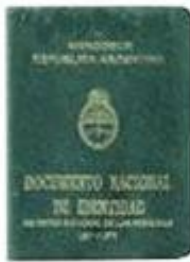
DNI VERDE MANUSCRITO