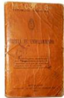
LIBRETA DE ENROLAMIENTO