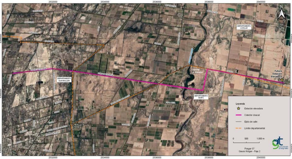
Figura 1 Ubicación de la traza del colector.

A continuación en la figura N°1 se muestra el mapa de ubicación del proyecto (MGIA):