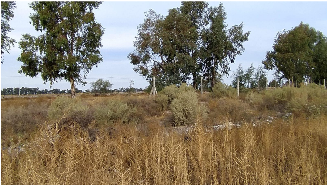
Imagen N° 7: Vista hacia los terrenos de la planta desde calle La Intendencia.