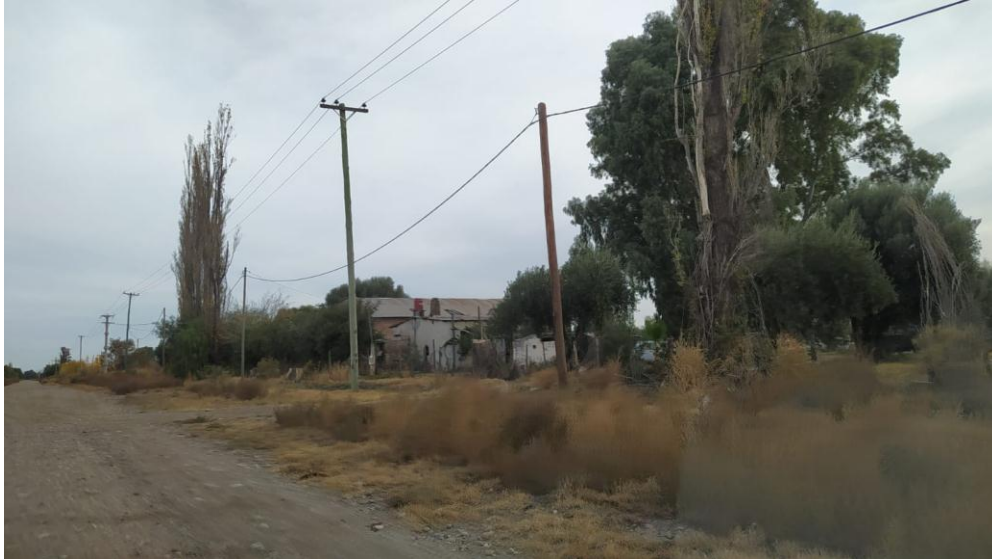
Imagen N° 4: Vivienda más cercana, ubicada a 300 metros hacia el Suroeste del establecimiento.