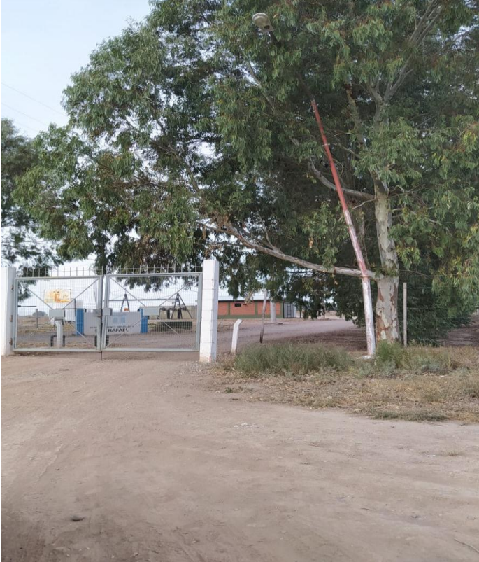
Imagen N° 1: Entrada a la Planta Depuradora Cuadro Nacional.

El proyecto se encuentra ubicado sobre calle De la Intendencia, 2,4 km. al Norte de la Ruta 146, Departamento de San Rafael, Provincia de Mendoza.