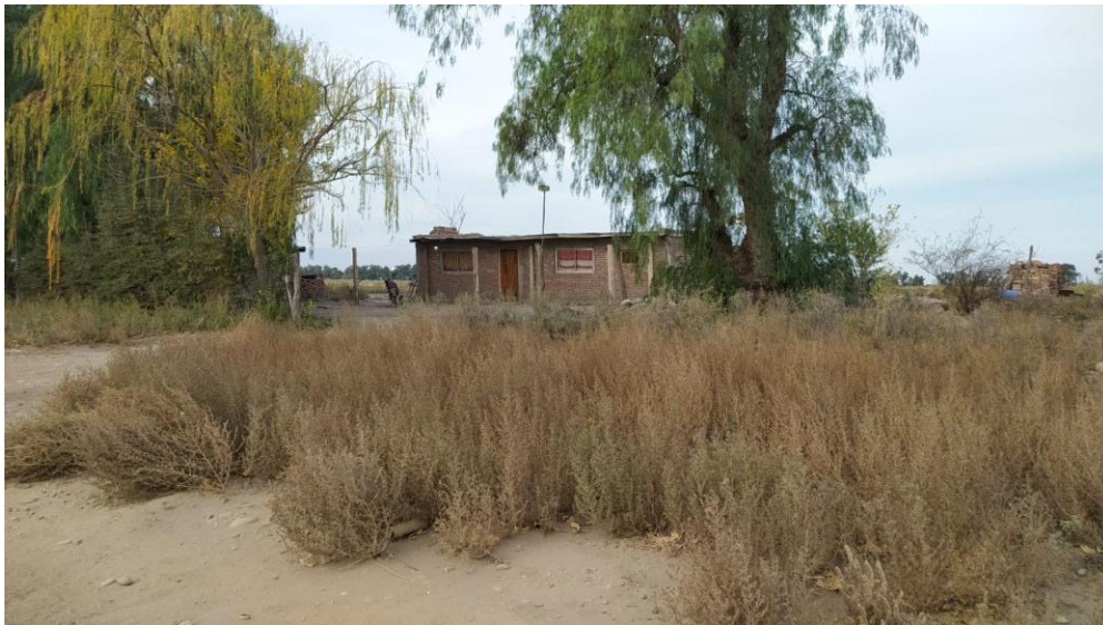
Imagen N° 5: segunda vivienda, ubicada a 450 metros al Noroeste del Establecimiento Depurador.