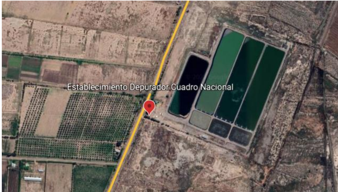
Imagen N° 2. Localización del sitio.

En la Imagen N° 2 se observa, en color amarillo, la calle de La Intendencia, calle por donde se ingresa al establecimiento Depurador Cuadro Nacional. En color rojo se demarca el punto de ingreso.