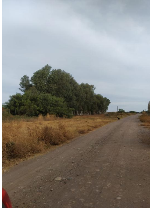
Imagen N° 6: vista desde calle De la Intendencia hacia el ingreso del Establecimiento Depurador Cuadro Nacional.