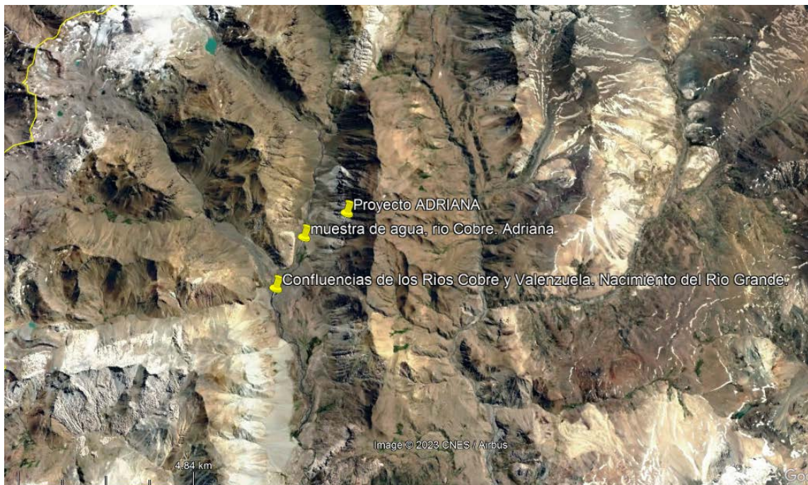
Punto de muestro tomado por la empresa sobre el Río Cobre.