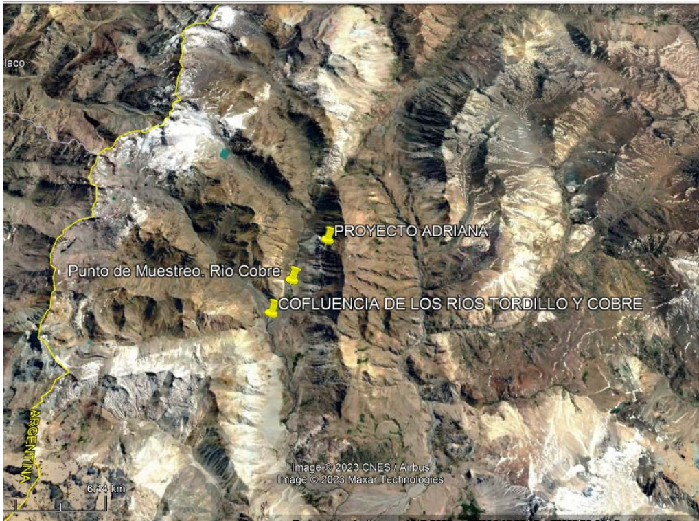
Punto de muestro tomado por la empresa sobre el Río Cobre.