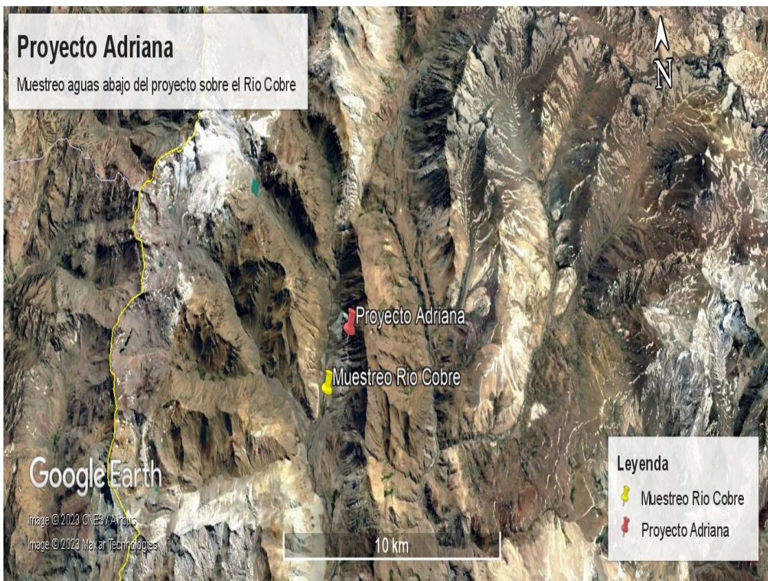
Punto de muestro tomado por la empresa sobre el Río Cobre.