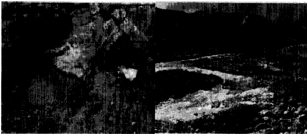
Figura N°1 (Izquierda): Arroyo Las

Vale destacar que en la zona de la Mina Las Choicas se observó un pequeño drenaje natural temporal de coloración amarilla que aporta el arroyo Las Choicas. Esta coloración indicaba potencia acidez del curso de agua que se confirmó con las mediciones a campo realizadas en las campañas previas.