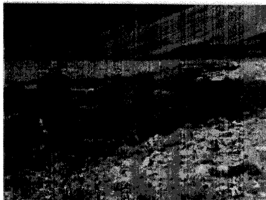
Figura N°3: Arroyo Perdido -

Fuente Informe de Impacto Ambiental " Proyecto Las Choicas".