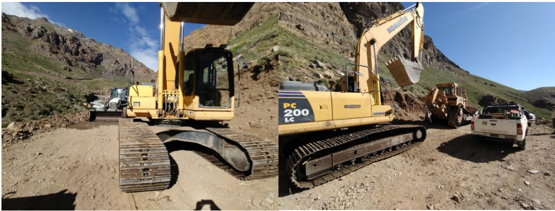
Foto 3: Imágenes de las máquinas que realizaron la apertura de camino.