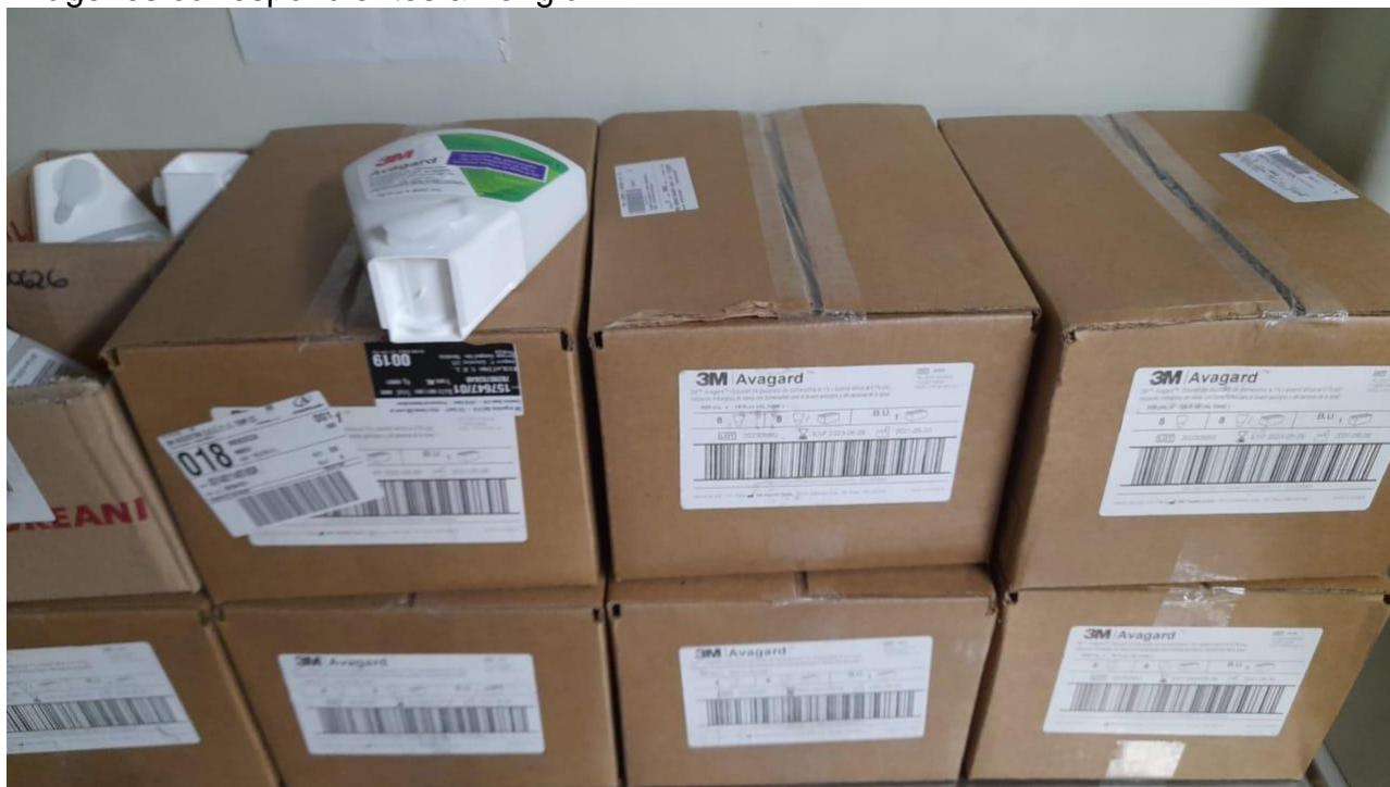
Imágenes correspondientes al renglón 1.