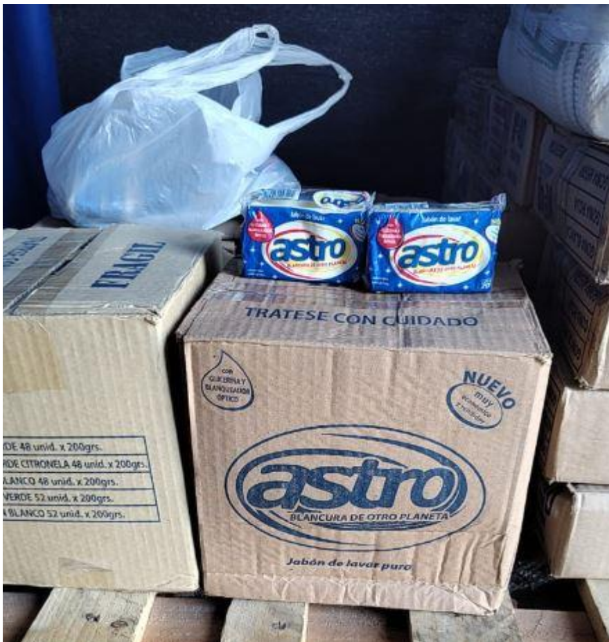
Imagen correspondiente al renglón 1:

Se adjunta a la presente acta archivos de imágenes de la mercadería recepcionada, en el Área ut supra mencionada, imagen del remito número 1-527 y factura número 2-135 forman parte de la presente.