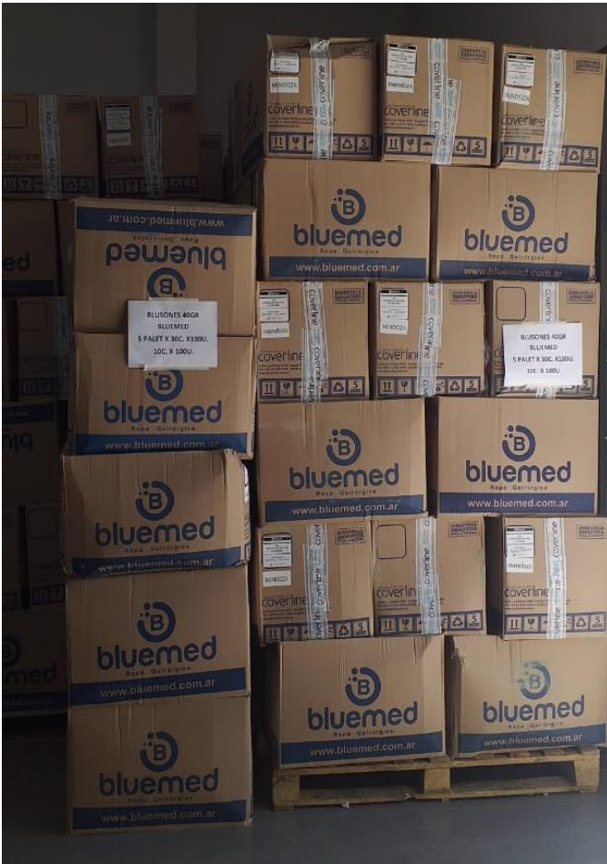
Imagen de la mercadería correspondiente al renglón n° 2:

Se adjunta a la presente acta imagen del remito 3-3737, correspondiente a la empresa proveedora. También imágenes de la mercadería con sus embalajes y demás. Dichas imágenes forman parte de la presente.