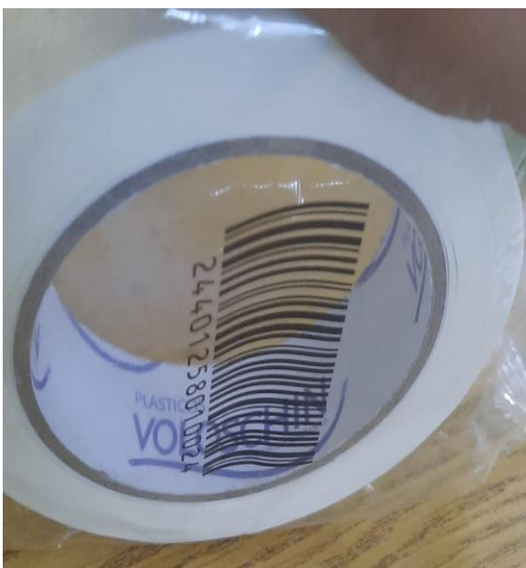
Imagen de la mercadería correspondiente al renglón n° 29:

Se adjunta a la presente acta imagen de la mercadería entregada por la empresa proveedora, del remito número 1-6464 y de la factura número 4-2110, correspondiente a la empresa proveedora. Dichas imágenes forman parte de la presente.