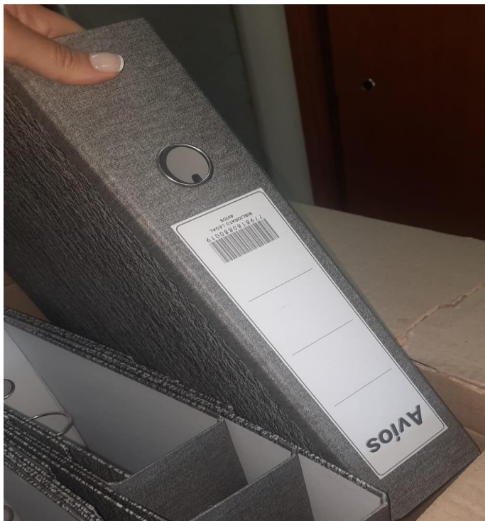
Imagen de la mercadería correspondiente al renglón n° 8: