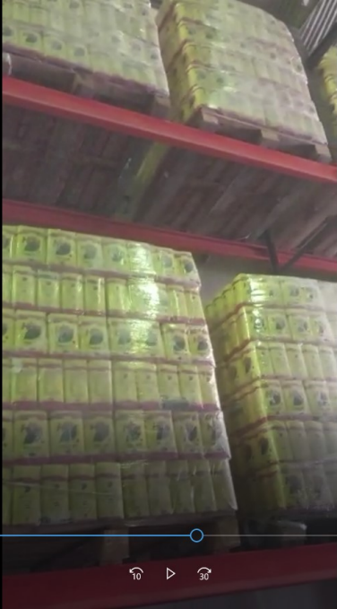
video con pallets descargados