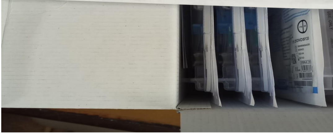
Imagen del remito de la firma proveedora: