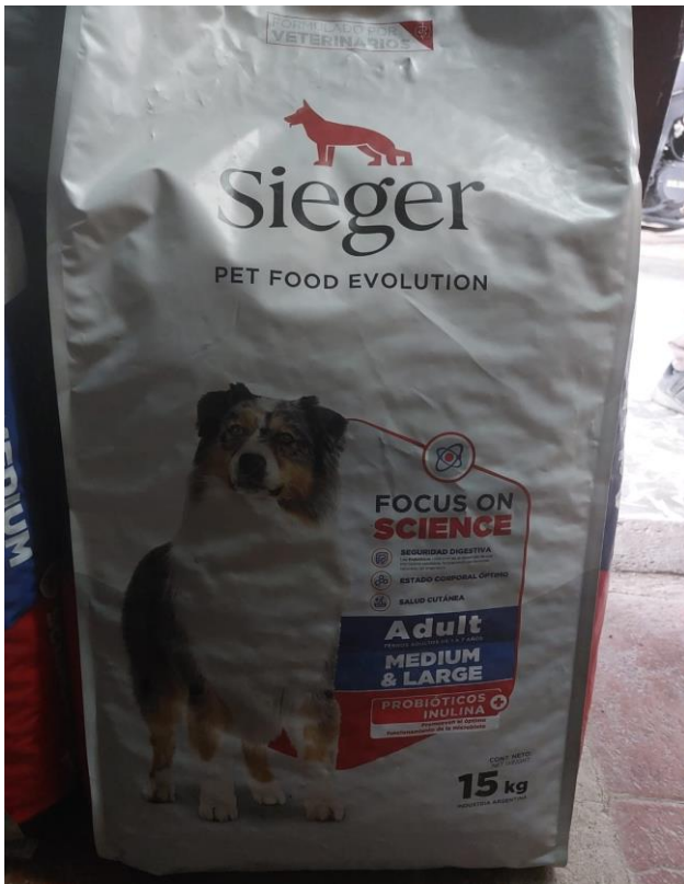
Imágenes correspondientes al renglón 2: