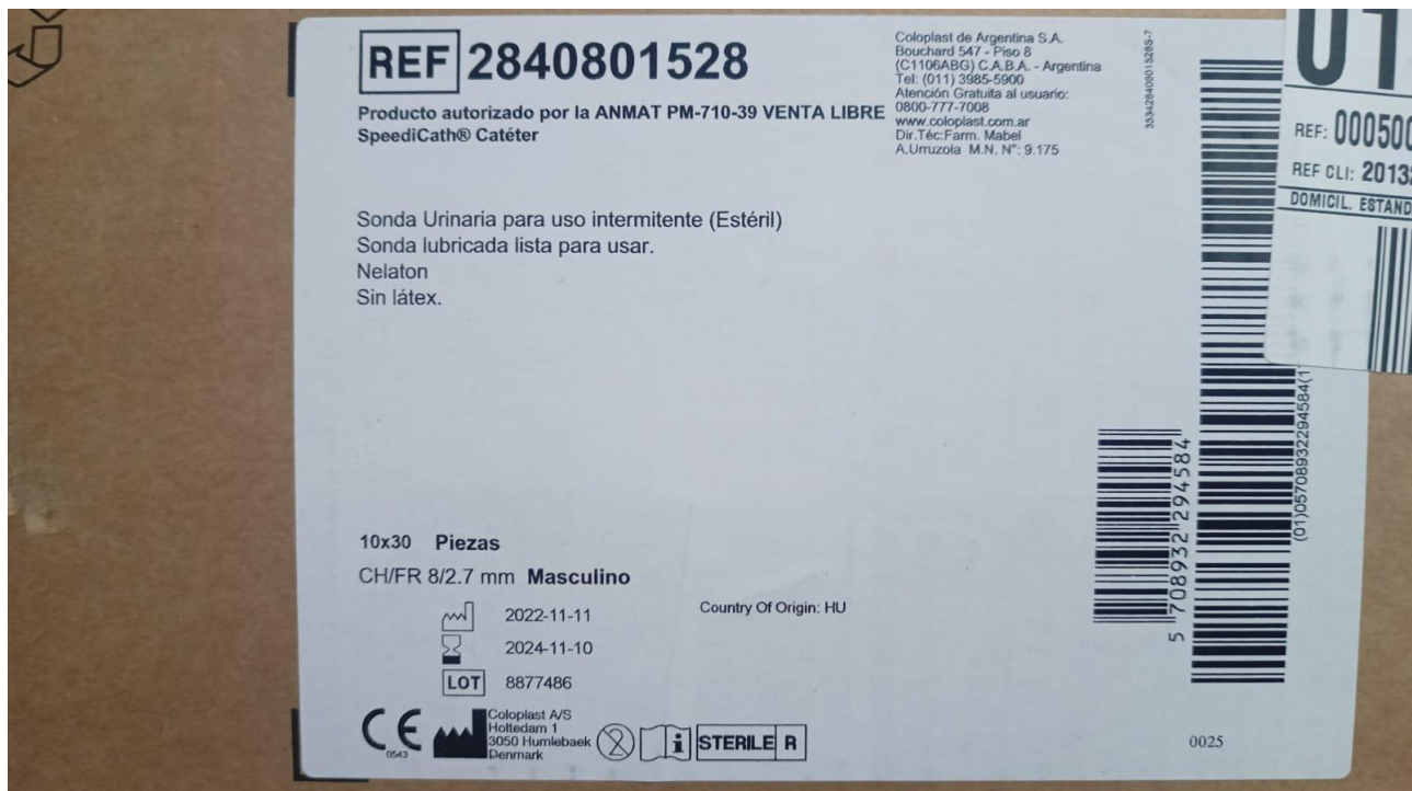
Imagen de la mercadería correspondiente al renglón n° 1:

Se adjunta a la presente acta imagen de los remitos 2-151308 y 2-151067 correspondiente a la empresa proveedora. También imágenes de la mercadería con sus embalajes y demás.