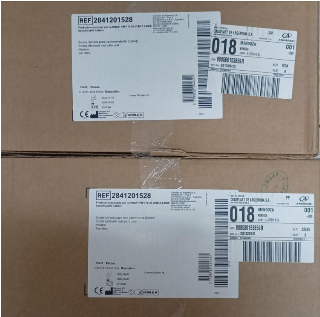
Imagen de la mercadería correspondiente al renglón n° 4: