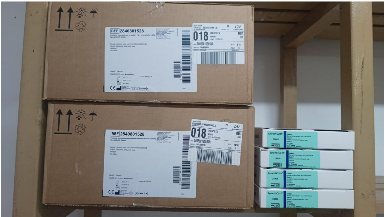
Imagen de la mercadería correspondiente al renglón n° 2: