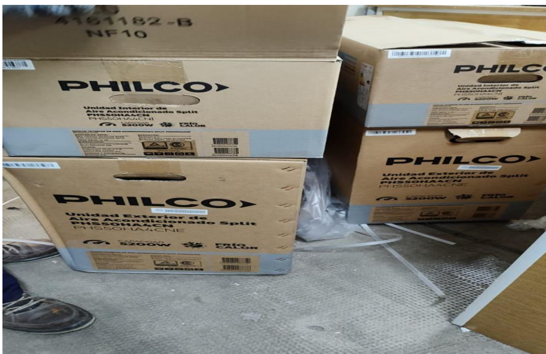
Imagen de la mercadería correspondiente al renglón n° 4:

Se adjunta a la presente acta imagen de los remitos 8-113853 y 8-113874 correspondiente a la empresa proveedora. También imágenes de la mercadería con sus embalajes y demás. Dichas imágenes forman parte de la presente.