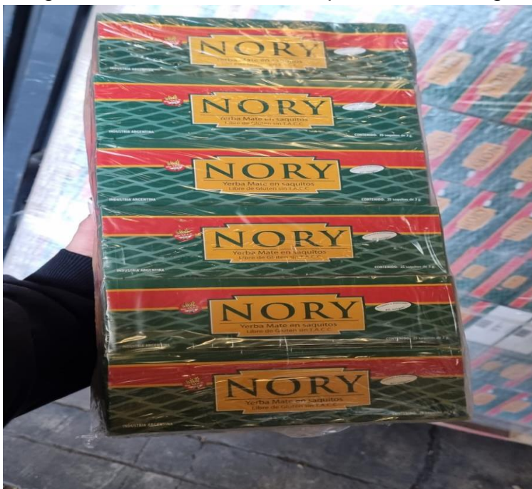
Imagen de la mercadería correspondiente al renglón n° 123:

Se adjunta a la presente acta imagen de la mercadería entregada, y su estiba correspondiente, por la empresa proveedora con remito número 1-22203. Dichas imágenes forman parte de la presente.