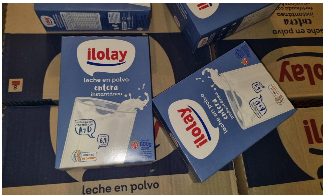
Imagen de la mercadería correspondiente al renglón n° 123:

Se adjunta a la presente acta imagen de la mercadería entregada por la empresa proveedora con remito número 8-114711 y factura número 123-4429. Además, se adjuntan a la presente acta imágenes de la mercadería entregada y su estiba correspondiente. Dichas imágenes forman parte de la presente.