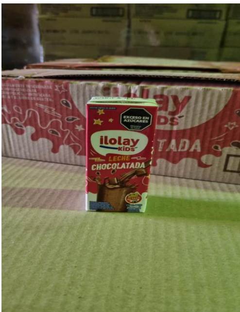
Imagen de la mercadería correspondiente al renglón n° 1:

Se adjunta a la presente acta imagen de la mercadería entregada por la empresa proveedora con remito número 8-114724. Además, se adjuntan a la presente acta imágenes de la mercadería entregada y su estiba correspondiente e imagen del documento por el cual se le acepta el cambio de marca. Dichas imágenes forman parte de la presente.