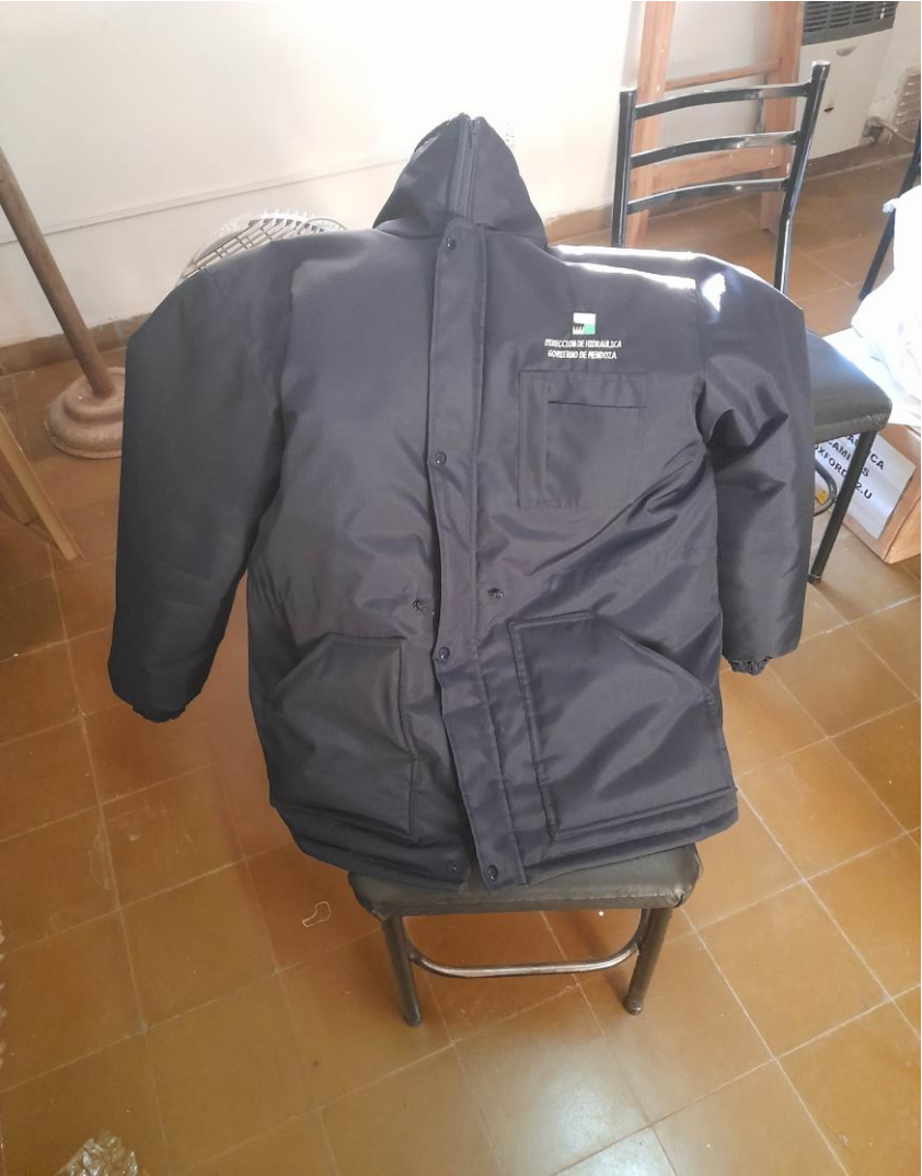
Imagen del reng. 9: