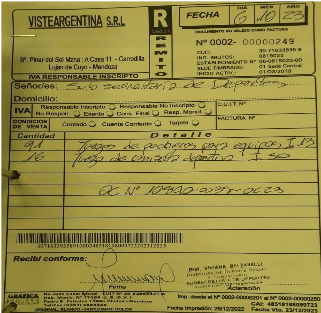
Imagen del remito de la firma proveedora: