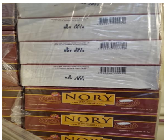
Imagen de la mercadería correspondiente al renglón n° 140:

Se adjunta a la presente acta imagen de la mercadería entregada por la empresa proveedora con remito número 1-22479. Además, se adjuntan a la presente acta imágenes de la mercadería entregada y su estiba correspondiente e imagen del documento por el cual se le acepta el cambio de marca. Dichas imágenes forman parte de la presente.