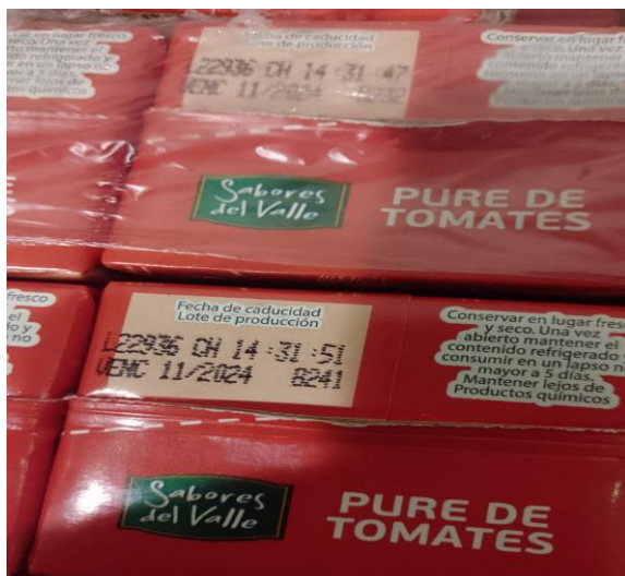
Imagen de la mercadería correspondiente al renglón n° 86:

Se adjunta a la presente acta imagen de la mercadería entregada por la empresa proveedora con remito número 1-22478. Además, se adjuntan a la presente acta imágenes de la mercadería entregada y su estiba correspondiente e imagen del documento por el cual se le acepta el cambio de marca. Dichas imágenes forman parte de la presente.