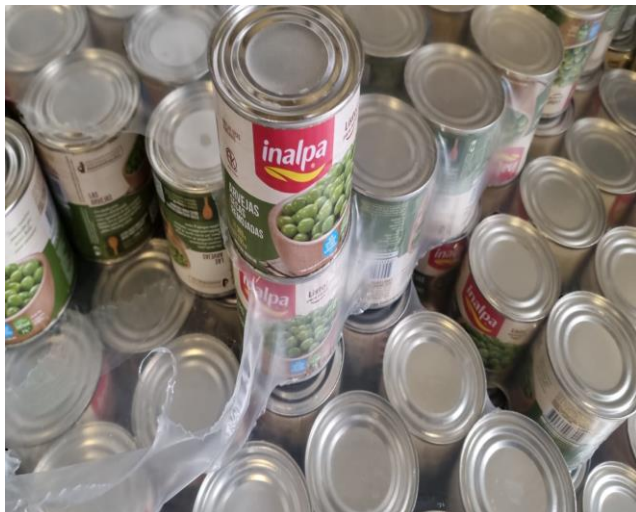
Imagen de la mercadería correspondiente al renglón n° 127:

Se adjunta a la presente acta imagen de la mercadería entregada por la empresa proveedora con remito número 8-115041. Además, se adjuntan a la presente acta imágenes de la mercadería entregada y su estiba correspondiente e imagen del documento por el cual se le acepta el cambio de marca. Dichas imágenes forman parte de la presente.