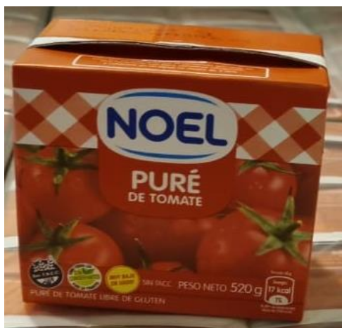
Imagen de la mercadería correspondiente al renglón n° 1:

Se adjunta a la presente acta imagen de la mercadería entregada por la empresa proveedora con remito número 8-118033. Además, se adjuntan a la presente acta imágenes de la mercadería entregada y su estiba correspondiente e imagen del documento por el cual se le acepta el cambio de marca. Dichas imágenes forman parte de la presente.