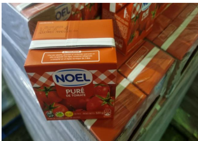
Imagen de la mercadería correspondiente al renglón n° 1:

Se adjunta a la presente acta imagen de la mercadería entregada por la empresa proveedora con remito número 8-118038. Además, se adjuntan a la presente acta imágenes de la mercadería entregada y su estiba correspondiente e imagen del documento por el cual se le acepta el cambio de marca. Dichas imágenes forman parte de la presente.