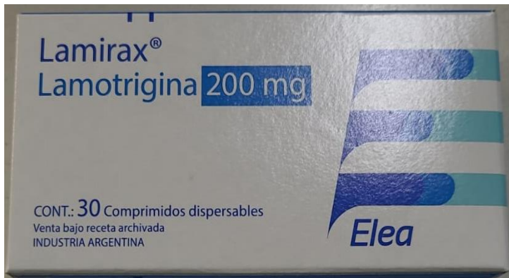
Imagen de la mercadería correspondiente al renglón n° 19: