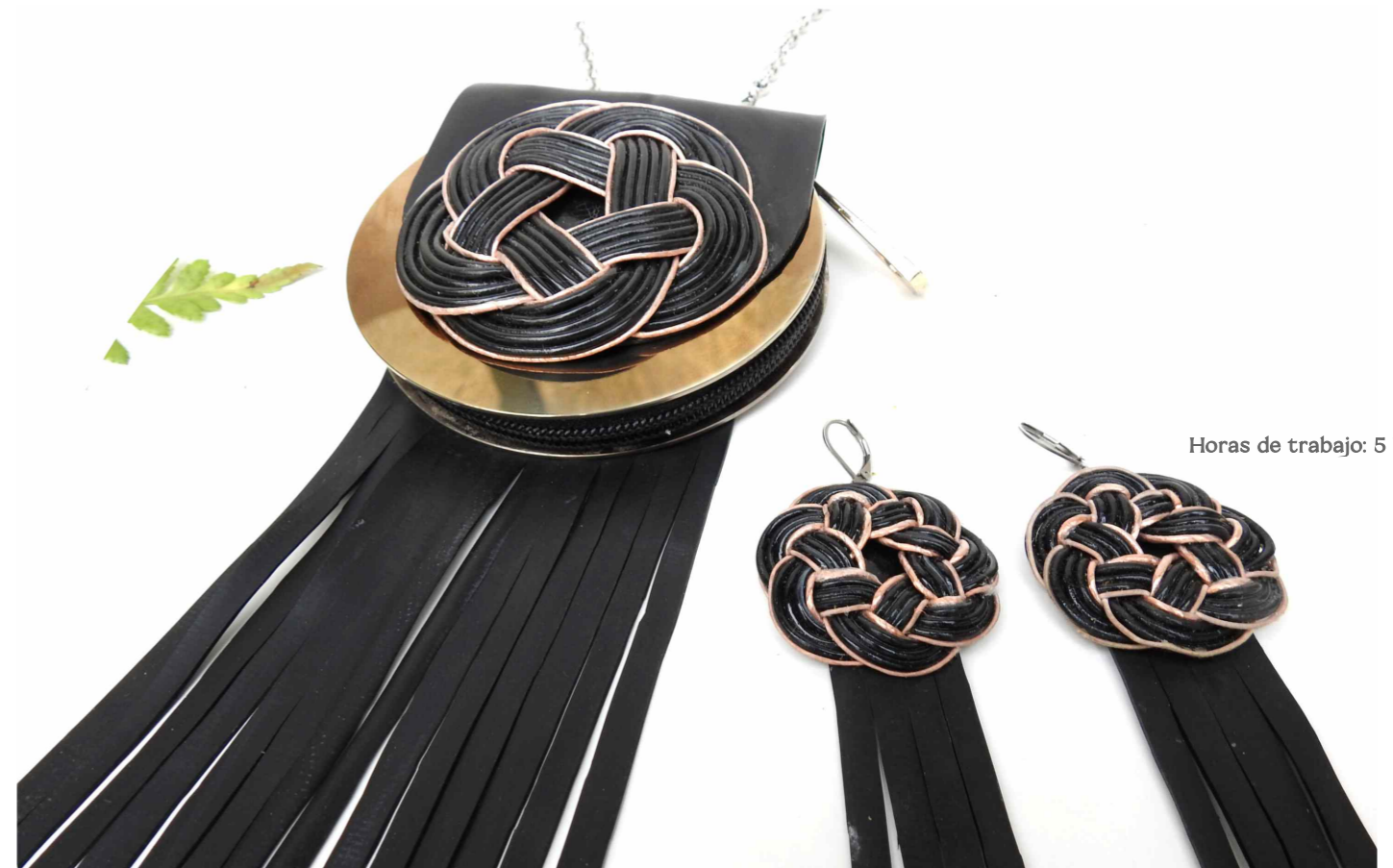
Horas de trabajo: 5 hs