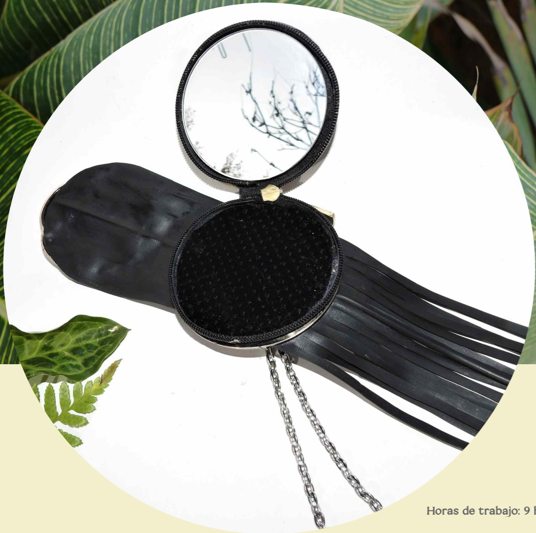
Horas de trabajo: 9 hs

Conjunto urbano y versátil compuesto por aros largos y minicarera que puede usarse como colgante frontal y/o lateral, como así también en un cinturón a modo de riñonera.